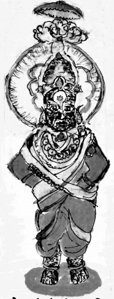
పాండురంగ కాంతి దివ్యతేజ యుళకల్

ఒకనాటి రాత్రి శ్రీకృష్ణుడు బృందావనంలో గోపీమణులతో రాసక్రీడ జరుపుతుండగా, భర్తను వెతుకుతూ అక్కడికి వచ్చిన రుక్మిణి గోపికలతో