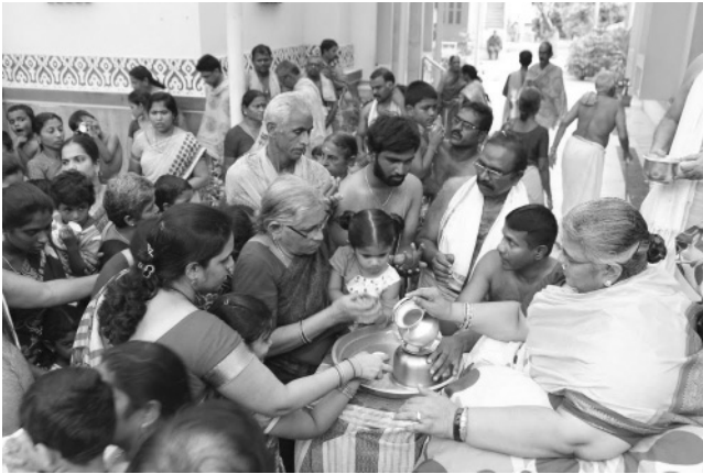
కుంకుమ పూజ అనంతరం భక్తులకు తీర్థం ఇస్తున్న శ్రీ మాతాజీ