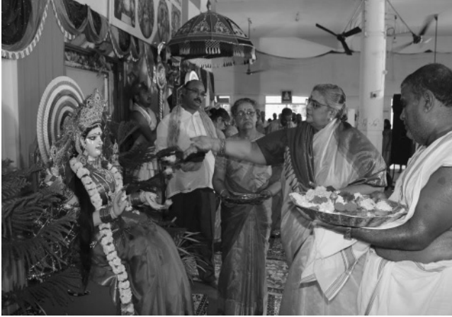
దసరాలో సత్సంగ సమావేశానికి సభకు విచ్చేసిన శ్రీమాతాజీ